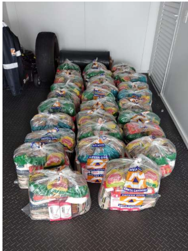
Entrega de Cesta Básica para o Município de São Bento do Sul.