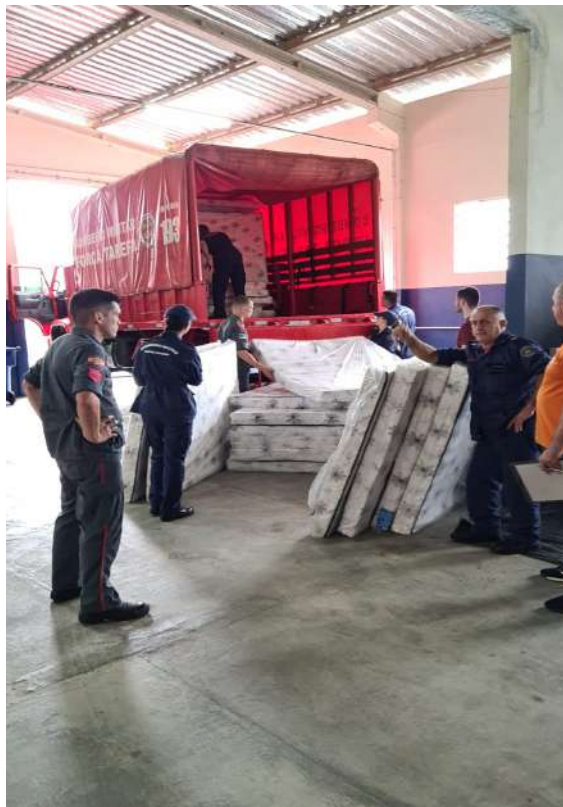
Retirada de IAH do Celog de Rio do Sul com apoio do CBMSC para o Município de Joinville.