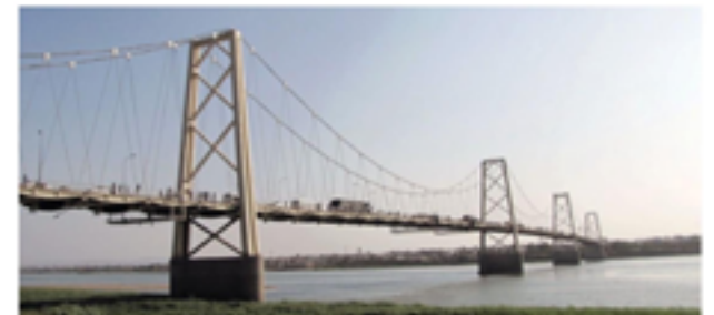
Ponte Samora Machel, Moçambique.