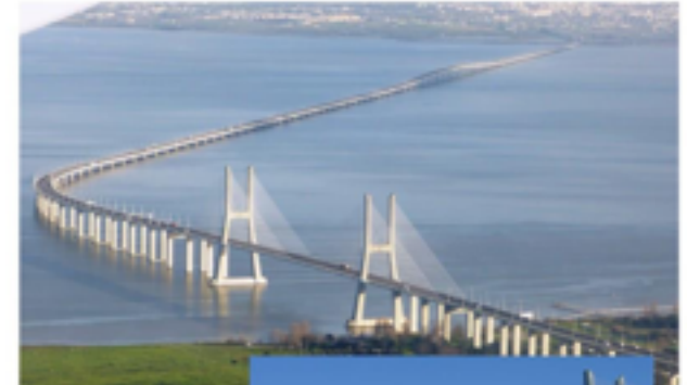
Ponte Vasco da Gama, Portugal.