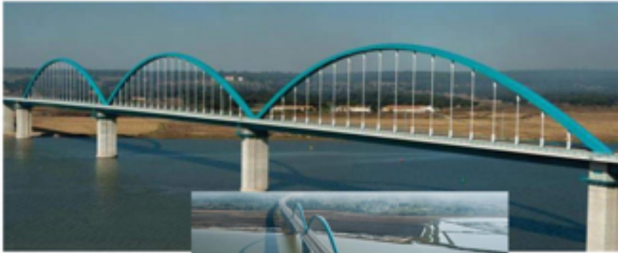
Ponte de Alcácer do Sal, Portugal.