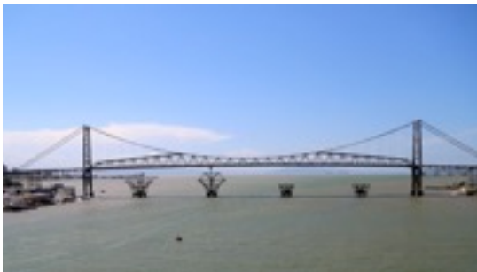
Época da rescisão