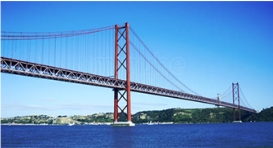
Ponte 25 de Abril, Portugal.